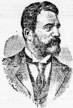
Geheimer Staatsrat Wallot.

Nach den Verhandlungen des Reichstags vom 1. März lag es klar am Tage, daß der Rücktritt des Kaisers in eine höchst peinliche Lage gerieten war, über die ihm auch das Vertrauen der germanischen Nation nicht hinweggeföhrt konnte.