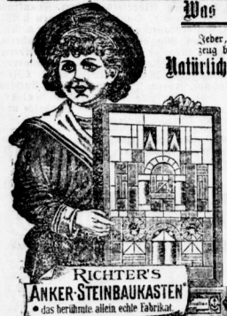
RICHTER'S ANKER-STEINBAUKASTEN das berühmte allein echte Fabrikat

Man merke aber mit dem Einkauf nicht bis zum letzten Augenblick, sondern verlange recht frühzeitig ausdrücklich Wahre Anker-Steinbaukasten und weise jeden Kasten, auf dessen Einseite nicht deutlich die Fabrikmarke „Anker“ zu sehen ist, ebenso als unecht zurück ; denn für sein edles Geld kann man auch das echte Fabrikat verlangen. Und wer sich erköhlt selbst fragt: Warum soll gerade unser Kind eine Nachahmung bekommen? der wird sicherlich jede ihm vorgelegte Nachahmung mit Entrüstung zurückweisen und ohne weiteres in ein anderes Geschäft gehen, wenn ihm nicht sofort ein echter, mit der berühmten Ankermarke versehenen Kasten vorgelegt werden sollte. Ausführliche Preisliste finden auf Wunsch gratis und franco: H. W. Richter & Cie. in Rudolstadt, Weimar, Wien, Ulm, Rotterdam, New-York.