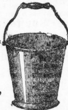
Großemail. Wassereimer, extra stark Email. à 1,10 u. 1,25 Mk.

Anfertigung emailirter Thür- und Straßenschilder in allen Größen.