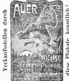
Verkaufsstellen durch diese Plakate kenntlich!

der Ad. Berg'schen Konfektmanufaktur. Wirtschaftsgegenstände, Galanteriewaaren, Spielwaaren, Porzellan, Glas.