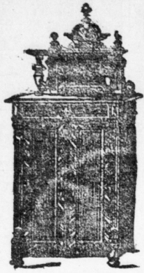
Echt ausserhalb Veritkov M. L. 66.