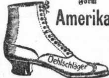
Beste Ergebnisse der Schuh- Industrie.