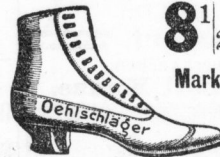
Weiches Sattelleder, angenehmer Sommerstiefel.