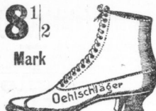
Engl. und Wiener Schritte mit hohen und niedrigen Absätzen. Form

Der Fuß ist ein so wichtiges Glied des menschlichen Körpers, daß Jeder auf eine bequeme Fußbekleidung achten sollte.