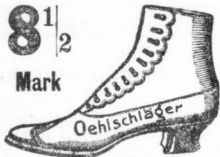
Weiches braunes Leder, hell und dunkel.

sind nicht nur die besten, sondern auch die bequemsten.