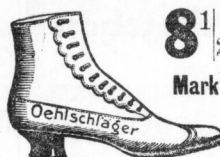
Vorzügliches Kalbleder garantirt.