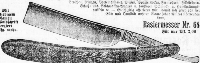
Rasiermesser Nr. 64 für nur Mt. 2.00

Wir beliebigem Namen in Goldschrift verziert 10 Pfa. mehr.