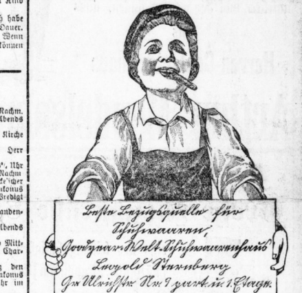
Portrait of a man with a mustache, likely the author or a related figure.