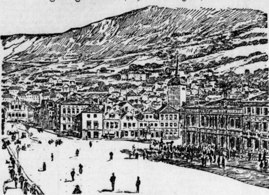
Marktplatz in Bergen.