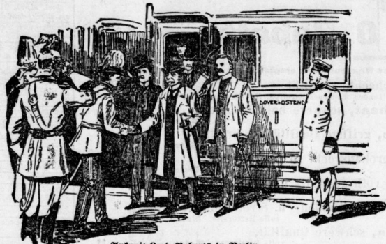
Ankunft Lord Roberts in Berlin.

1 Posten Schmidt'sche Wolle Altenburg \frac{1}{5} Pfd. 50 Pfg. 1 Posten Kraftwolle \frac{1}{5} Pfg. 40 Pfg. 1 Posten Macco-Hemden, Hosen, Jacken , früher Stück bis 3 Mk., jetzt 1 Mk. Martin Giesenow, Gr. Ulrichstrasse 58.