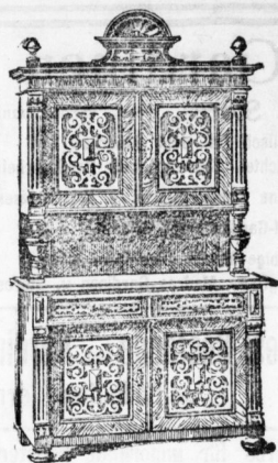
1 nussb. Büffet, innen Eiche, M. 175.

Enorme Billigkeit unter Verwendung denkbar bester Materialien.