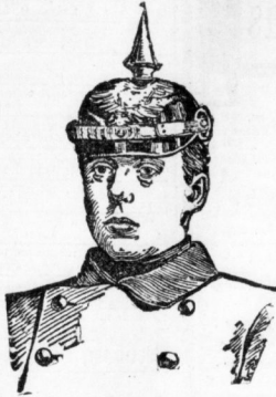
Großherzog von Sachsen-Weimar.