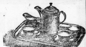
Kinder-Kaffeesevice von 1 Mark an bis 9 Mark.

Deutschlands größtes Special-Geschäft. Mitglied des Rabatt-Spar-Vereins.