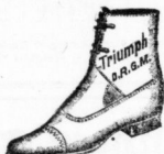
Schulstiefel für Knaben und Mädchen, sehr dauerhaft und elegant.