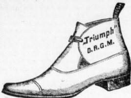
Beliebtester Strassenstiefel in Boxcalf und Wicksleder, in extrabreiten und bequemen Formen.

über die Gründe, welche den durch den neuen Triumphstiefel erzielten anserordentlichen Erfolg verursacht haben.