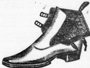
Für Rheumatismusleidende warm gefüttert, sehr bequeme Form.