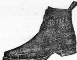
Für Jäger und Touristen in extrahohem Schaft, mit wasserdichter Einlage, durchaus Lederfütter, geschlossene Lasche, Doppelsohlen.