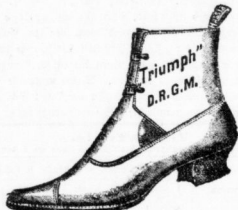
Eleganter Damenstiefel in Boxcalf. in extrabreiter Form u. warm gefüttert für leidende Füße.