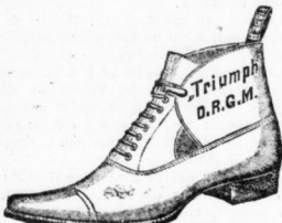
Bester Ersatz für Schnürstiefel, sehr elegant.