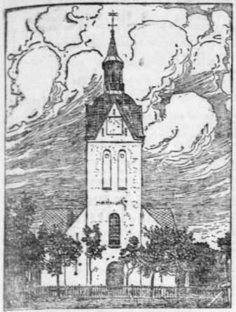
Die Hauptkirche von Aalefund.