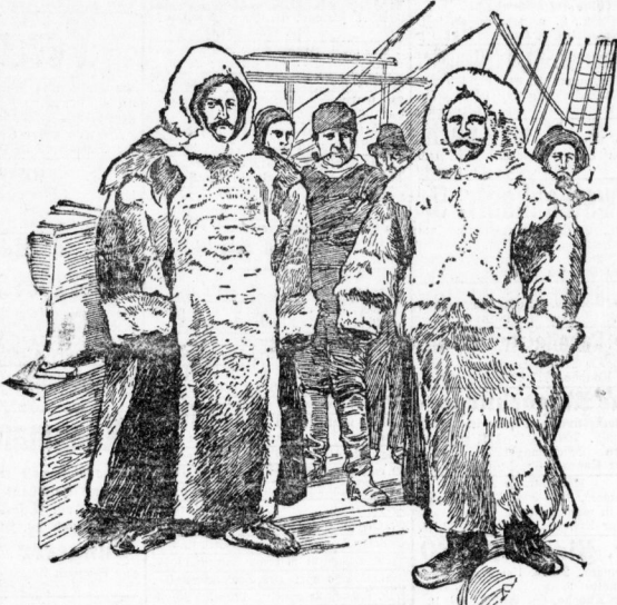
Offiziere in ihrem Polaranzug.