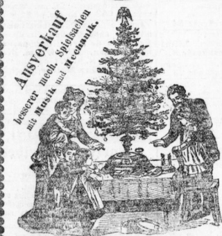
Christbaumständer mit Musik, Baum drehend, über 100 Stille spielend.