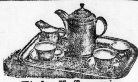
Kinder-Kaffeesservice von 1 Mark an bis 9 Mark.

Deutschlands größtes Spezial-Geschäft. Mitglied des Rabatt-Spar-Vereins.