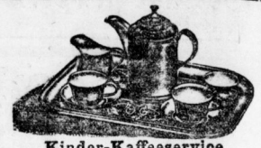
Kinder-Kaffeeservice von 1 Mark an bis 9 Mark.

Deutschlands größtes Spezial-Geschäft. Mitglied des Rabatt-Spar-Vereins.