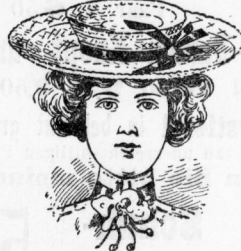
Elegante Bretonform aus Fantasie- geflecht mit chicer Seidenband- od. Sammet- band-Garnitur und Agraffe 1.65 Mk.