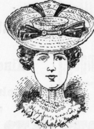
Elegante Marquisform aus feinst. Naturgeflecht m. eleg. Sammet- u. Kugelgrafftagarnitur 2.25 Mk.