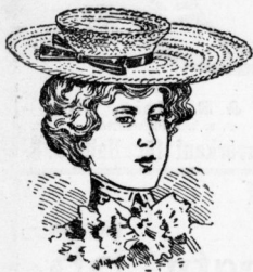
Bretonform mit Sammet- od. Seidenband flott garniert 65 Pfg.

Haupt-Spezialität: Garnierte und ungaranierte Damen- und Kinder-Hüte von dem einfachsten bis zum feinsten Genre in gleich grosser Auswahl und zu anerkannt allerbilligsten Preisen.