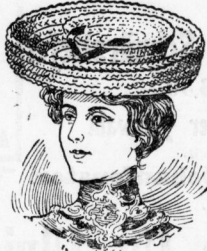
Boleroform aus Fantasiegeflecht mit Sammetbandgarnier. u. Agraffen 85 Pfg.