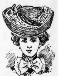
Elegante Chasseurform aus feinstem Fantasiegeflecht mit Chinseide reich garniert 2.75 Mk.