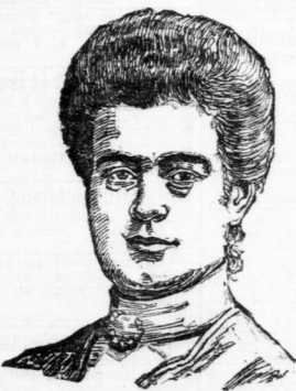
Prinzessin Johann Georg von Sachsen.

* Nr. 100. Die Veteranenbeihilfe erhalten nur solche Veteranen, welche vertrieben wurden und vor allem bedürftig sind. (Während Sie Kasse zu haben, so ist ein bedürftiger Mann dem zuständigen Kommando unter Vorlegung der Militärpapiere am besten mündlich zu stellen.)