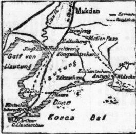
Port Arthur zur Lage vor Port Arthur.

Brummer & Benjamin, Grosse Ulrichstrasse 22-23.