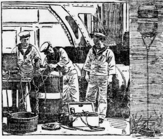
Anlaufleitung und Auslegen moderner Seeminen.

Bei der Einweisung von Vort Anker spielen Winen eine überaus wichtige Rolle. Die Rollen haben auf der Landseite wie zur See eine große Anzahl von Winen zum Schiffe und zur Verankerung über die See hinaus gelegt.