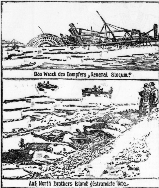
Das Wrack des Dampfers „General Slocum.“