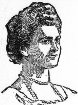
Eleonore Prinzessin zu Solms-Hohensolms-Lich.

Eiserne Bettstellen Gr. Ulrichstrasse 21. von Mk. 4,50 bis zu den elegantesten. Mitglied des Rabatt-Spar-Vereins.