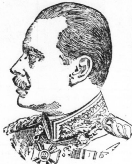
Großherzog Ernst Ludwig von Hessen.