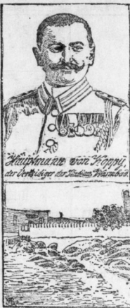
Nenes vom Aufstande in Deutsch-Südwestafrika.

Gr. Ulrichstrasse 21. Mitglied des Rabatt-Spar-Vereins.