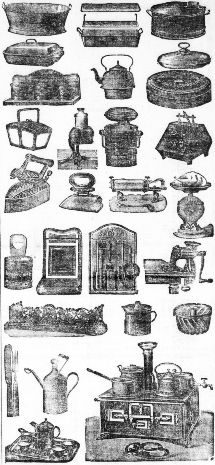
Kinder-Kaffee-Service von 1 Wt. an bis 9 Wt. Kinder-Kochherde von 50 Fig. an bis 30 Wt.

Erstes Geschäft: Leipzigerstr. Burghardt & Becher. Zweites Geschäft: Clearinsstr. am Markt. Mitglied des Rabatt-Spar-Vereins.