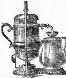
Kaffeemaschinen bester Qualität, Eiser- Universal- Reinstühle.

Reinigungs- und Waschmaschinen, Reinstühle, Reinstühle, Reinstühle, Reinstühle.