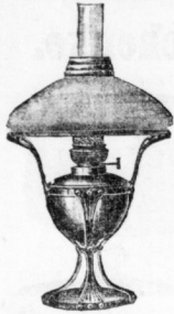
Moderne Tisch- und Hängelampen in Messing und Kupfer, matt oder blank. Spiritus-Glästlich, Ringeln, altheutische Laternen, Salonlampen mit Spigenzählern.