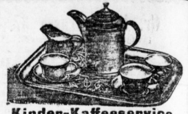
Kinder-Kaffeeservice von 1 Mark an bis 9 Mark.

Burghardt & Becher Deutschlands größtes Spezial-Geschäft. Mitglied des Rabatt-Spar-Vereins.