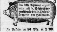
In Packeten zu 50 Pfg. u. 1 Mk.

in geschmackvoll ausgestatteten Präsent-Kisten empfiehlt in großer Auswahl in allen Verlagen Paul Kettel, Gr. Ulrichstr. 30. Preispr. 2127.