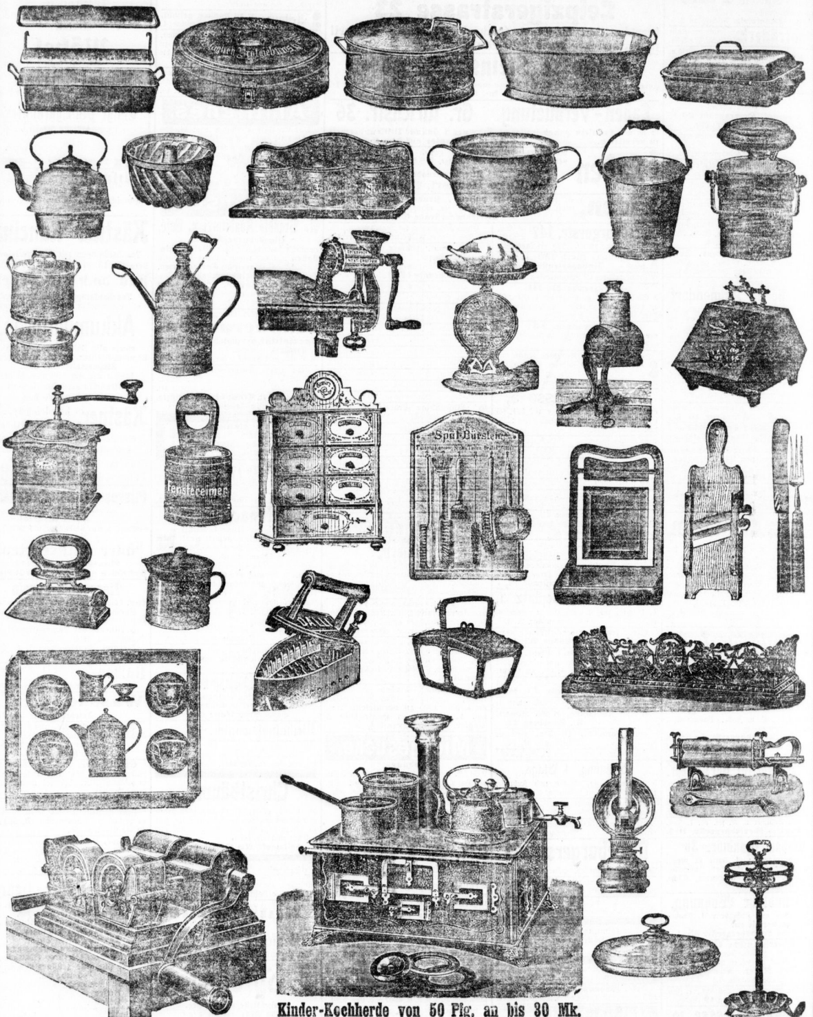
Kinder-Kochherde von 50 Fig. an bis 30 Mk.

Haupt-Geschäft: Leipzigerstrasse, am Turm.