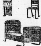
Satin, Mussam, Ankleideschrank mit Spiegel, 2 Bettstellen m. Matratzen, Waschtische mit Aufsatzspiegel, 2 Nachtschränke, 2 Stühle, 1 Handtuchständer ganz bedeutend herabgesetzter Preisen. Mk. 560

Eine Anzahl Salon-, Speise- und Wohnzimmer-Möbel, diverse Garaturen in Seide und Plüsch in ganz bedeutend herabgesetzter Preisen.