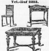
Eiche, Büfett, Patentausziehtisch, 4 Stühle, Anrichtentisch, grosses Sofa mit 576 schweren Moquette, Sofa-Aufbau, Mk.