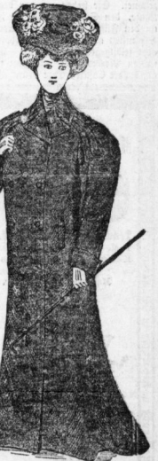
Frühjahrs - Paletot

„Eise“ Raglanform o. m. Keulenärmeln u. 3/4 m langem Krag. u. Aermeln mit seid. Aufschlägen. Fescher Wettermantel in imprägniertem wasserdichten u. engl. Stoff: 80.50 7 75 Derselbe in engl. Gummistoffen: 16 50