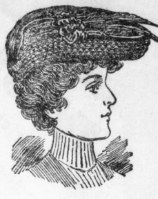
Eugenie , Brauentouque aus Plittgeflecht mit Seiden-, Blumen- und Poliergarnitur 4,80 Derselbe Hut in eleganter Verarbeitung 6,50