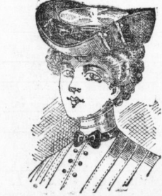
Alice , Toque aus gutem Strohhgeflecht mit Sammetband u. Agraffengarnitur 8,8 Pf.