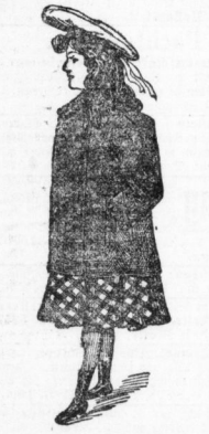
Mädchen-Jackett Margot aus unzerstörlichem blauen Cheviot mit reichen Zugporten bejept. Alle Größen vorrätig. 9,65