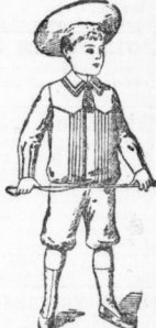
Knaben-Anzug Kurt aus reinwoll. Cheviot, sehr solider Stoff. In allen Größen vorrätig. 7,75