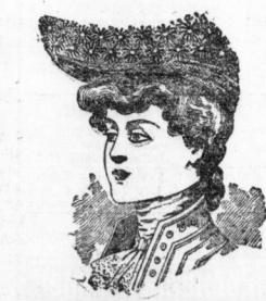
Lena , Marquis-Toque mit Marquärite Seidenstoff- und Seidenband-Gar. 9,90 nitur 5,75