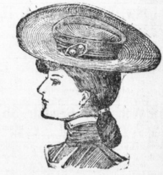
Sylvia , flache Form aus gutem Strohhgeflecht mit Sammet- und tmit. Seidengarnitur 1,65