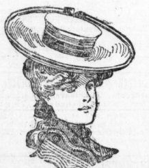
Marga aus gutem Strohhgeflecht mit Sammetband u. Agraffengarn. 9,5 Pf.