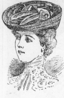
Helena , Brauentouque aus Splittgeflecht mit Harb. Seidenband u. 185 Derselbe Hut in besserer Ausführung aus Fantasia- u. Seiden. 4,50