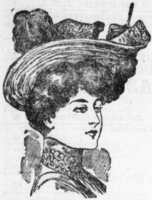
Norma , Chiffonhut mit 3 echten Kopfleben, reinsteichenen Netzweilervand u. Agraffengarnitur 9,25 Derselbe Hut in besserer Ausführung mit langer Amazone und 2 Kopfleben 12,50