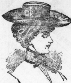
Regina , Amazone aus gutem Napangeflecht 9,5 Pf. Derselbe Hut in eleganter Ausführung 2,80 95 Pf.