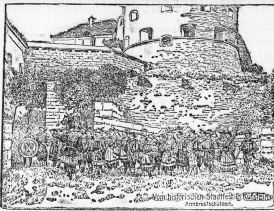
Vom historischen Stadtfest in Kurland. Armbrustschützer.