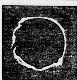
Die Roma bei der totalen Sonnenfinsternis am 17. August 1907.