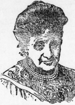
Prinzessin Amalie von Bayern

Prinzessin Amalie von Bayern ist in Nymphenburg bei München einem Schlaganfall erlegen. Sie war eine geborene Infantin von Spanien und wurde am 12. Oktober 1804 in Madrid geboren.