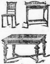
Büfett, Büfett, Patentausziehisch, 4 Stühle, Anrichtentisch, grosses Sofa mit schwerem Moquette, Sofa-Aufbau, Standuhr m. Werk Mk. 766