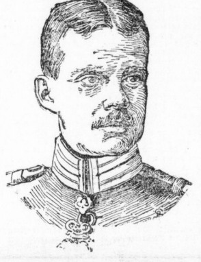
Prinz Georg von Bayern.