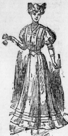
Kleid mit Arabeskenerei.

sehen. Auch die Hüfte, die außerordentlich positiv für beide Toiletten gewöhnlich sind, charakterisieren die Wintermode trefflich. Beide Formen sind