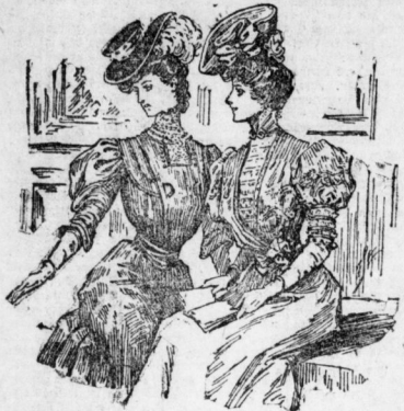
Kleid mit Puffe und Treppenhaken.

Es ist nun mal nicht anders, das Neue reizt! Aus seinem Gebiet menschlichen Willens und Schickens wird dieser, in der Wesens-Natur der begünstigten Schöpferin noch Abwechslung und Erneuerung mehr