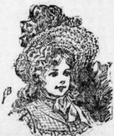
Hut mit reicher Garnitur für kleine Mädchen.

Sie ist weichen und verträglich in ihrer Beschaffenheit, die ihren festen Platz in unserer Welt haben, schnell aufgebracht, sie wird täglich ein oder zweimal, bei eleganten Frauen viele Male am Tage, gewechselt. Sie ist weichen und verträglich in ihrer Beschaffenheit, die ihren festen Platz in unserer Welt haben, schnell aufgebracht, sie wird täglich ein oder zweimal, bei eleganten Frauen viele Male am Tage, gewechselt.