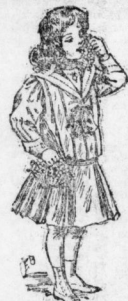
Wattrockfleid für Mädchen von 6 bis 12 Jahren.

Wichtig das Bildchen der beiden liegenden Figuren gibt den Eindruck mehr, den elegante Frauen in der kommenden Saison machen werden. Eine durch Ueberladung stierend zu wirken, sind reiche und glänzende Zeile in geschmackvoller Weise bei den Kleibern angebracht; beide Kleiderstücken sind ausgefallen und lassen je einen hellen Zugelast aus dünnen Stoffen