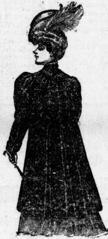
Eleganter Paletot aus prima Mohair, Astrachan und Seidenplüsch, allerbeste Verarbeitung. Preis 25, 35, 45 bis 150 Mk.