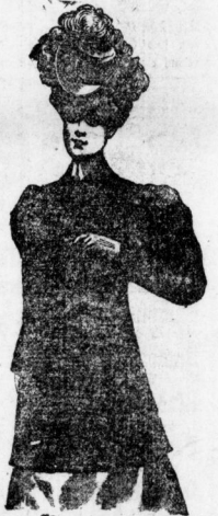
Übergangspaletot aus Covercoat, in allen Sportfarben, im Rücken geschweift, auch lose fallend, mit Sammetkragen. Preis 6.50, 10, 15 bis 35 Mk.