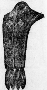
Pelz-Boss und Stolas in allen hellen u. dunklen Pelzsorten. Stück von 1 Mk. an.