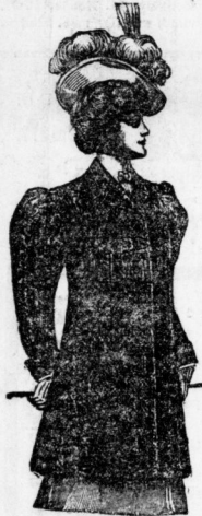
Astrachan-Jackett , durchweg gefüttert, 7.50, 11, 15 Mk. Aus la. Breitschwanz, in Ausführung wie vorstehendes Façon. Preis 16.50, 20 bis 45 Mk.