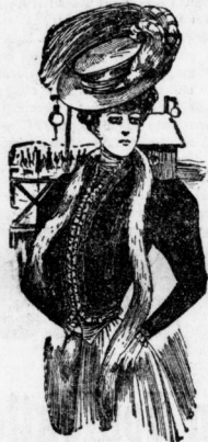
Nouveauté-Blusenfaçon , chik und geschmackvoll ausgeführt in Tuch, Astrachan u. Seidenplüsch. Preis 9, 12, 16 bis 50 Mk.