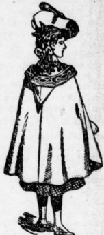
Mädchen-Gold-Kragen mit und ohne Kappe, in Längen von 50 bis 100 von 1.40 Mk. an. — Nouveauté Façons. —