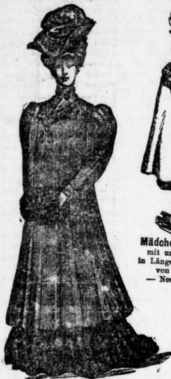
Eleganter Frauen-Paletot im Rücken mit Nouveauté-Falten, in extra weiten Größen stets am Lager. Preis 15 bis 45 Mk. — In weinrot, oliv u. hellen Tücheln, als Theatermantel zu tragen. Preis von 12 Mk. an.

In meiner großen Spezial-Abteilung für Damen- und Mädchen-Konfektion bringe ich in dieser Saison wieder eine unübertroffene Auswahl in allen Preislagen, vom einfachsten bis zum elegantesten Genre. — Ich bringe stets die schönsten Neuheiten und biete wirkliche Vorteile, da die Preise auf das allergeringste gestellt sind. Meine Konfektion zeichnet sich aus durch tadellosten Sitz und saubere Verarbeitung; die Befähigung der neuen Modelle ist auch ohne Kaufzwang gern geflattet.