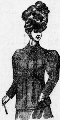
Jackett aus Double und Eskimo schwarz und marengo, im Rücken moderna ge- schwelter Schnitt, sehr verschieden garniert, vollständig abgefüttert. Preis 5, 7, 8, 10, 13 bis 35 Mk. Jackett aus Cheviot, mit Trese garniert, mod. Façon, Stück 3.25, 4 bis 6 Mk.