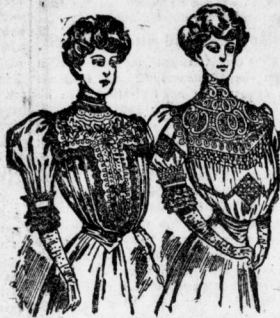
Blusen aus reinesel. Japon in allen Licht- farben, mit Tüll-Koller und Spitzen-Einsätzen reich garniert. Stück von 3.25, 5.—, 7.50, 11.—, 15.— Mk. In eleg. Ausführung aus Taffet, Musselin, Chiffon, schwarz und farbig, 18 bis 55 Mk.