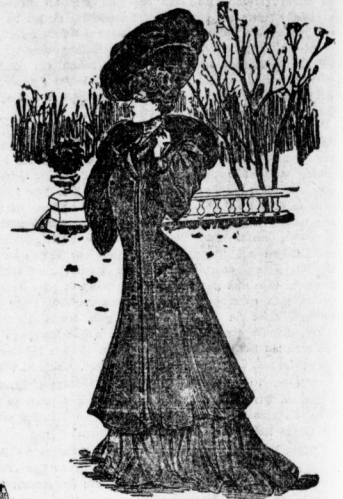
Eleganter anschließender Paletot, auf Solde gearbeitet, in verschiedenen Längen am Lager. Preis 14 bis 70 Mk.