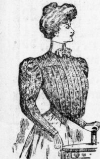
Wollene Bluse in modernen blau- grünen und karierten Dessins, ganz gefüttert, Stück 3.25, 5, 7.50 Mk. Aus gutem Velour in Fantasie- mustern Stück —.75 bis 3.50 Mk. Aus Sammet in neuen Schotten und ein- farbig, Stück 6.50 bis 25 Mk.