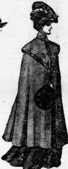
Frauenkragen , aus schwarz Double, Eskimo, durchweg gefüttert, mit Blinden garniert. Preis 5, 8, 11 bis 40 Mk. Golfcape , 100 bis 140 cm lang, in diversen Qualitäten, marengo Chinchilla mit angewebtem Futter und garnierter Pelerine. Stück 4.25, 5, 7, 9 bis 28 Mk. — In hellen Farben- stellungen mit Pelz garniert Preis 8, 9.50, 14, 18 bis 35 Mk.