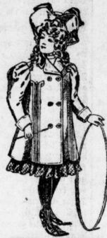
Mädchen-Jackets und Mäntel in allen Größen, Tuch, Sammet und englischen Stoffen. Preis von 1.50 Mk. an.