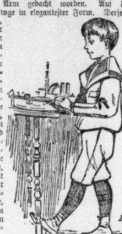
Matrosenanzug für Knaben von 5 bis 7 Jahren.

Tippen und lachenden Augen zu bezaubern zwingt! Ja zwingt! Lachendes Leben ist hübscher denn mancher Reicht und schöner als tote Form. Und wer da Lachen bringt und lebendige Freude, der sei gewürdigt! Es will ich von Neuen reden, das die Saison uns bringt. Die „Modewelt“ und „Malerische Frauen-Zeitung“ vom 1. Dezember (Bertag Franz Asperheide in Berlin W. 35), werden die neuentstehenden Abteilungen antworten, und die Leser auf das beste unterrichten sind, hüben und in Wert und Wohl eher eleganten und praktischen Köchinnen allerlei Neuigkeiten vor, die für das kommende Weihnachtsfest zu kennen bedeutsam sein dürfte. Ulrich der Artikel: „Lecher Schmaud und elegante Toilettengeheimnisse“ redet über allerlei Wüchsenwert. Er zeigt im Bild die charakteristischen Formen für Ringe, Handbänder und Ketten. Mit einem