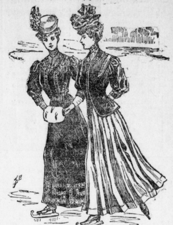
Zwei Kostüme für Gesipport.

Gern schmücken wir die Gesipport, mit denen unsere Kinder in tägliche Bekleidung kommen, mit Bildern, die sie einladen, sofort ausgeprägten Tinten Menschen und Tiere darzustellen. Eine Kostümle ist inhaltlich dem kindlichen Verständnis voll angepaßt. Welch Kind freut sich nicht über Blätter, Hasen, Enten und Küken! Wie sie den Jafas-Bog herabwachteln! Nach Klang und mit Würde! Eins nach dem andern! Welch Erwachsener wird nicht lachen über den köstlichen Humor in Plänen- und Raubgehung, welcher aus all den feinen Tieren spricht. Jedoch. — Eins nach dem andern! Und wer da Lachen bringt und lebendige Freude, der sei gewürdigt! O. O.