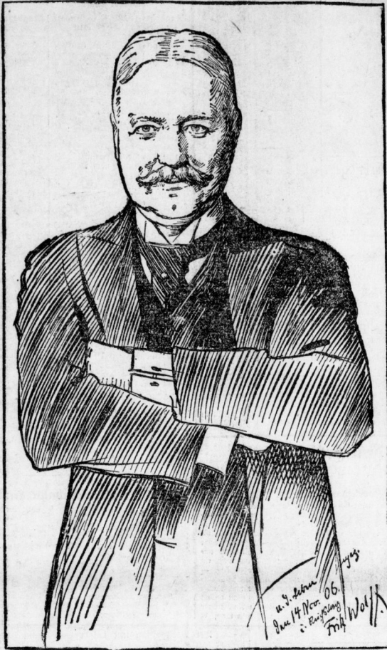
Fürst von Bülow in der Reichstags Sitzung am 14. November 1906.

Dass die Generalung des Fürsten von Bülow von seinem Unfälle eine vollständige ist, geht wohl am besten daraus hervor, dass sich der Kaiser entschlossen hat, jetzt, bei Beginn der Reichstagsverhandlungen, die Verhütung der Regierung selbst zu vertreten. Der Reichskanzler würde sich diese schwierige Aufgabe sicher nicht zumuten, wenn er sich nicht vollstän-