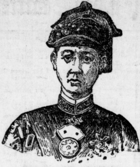
Hau-Thai, Kaiser von Annam.