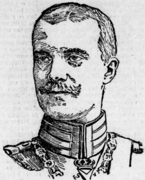
Prinz Friedrich Heinrich von Preußen.

Prinz Friedrich Heinrich von Preußen ist bekanntlich als Nachfolger seines Vaters zum Kommandeur des Johanniter-Ordens ernannt worden. Der Prinz liegt im 33. Lebensjahre. Am 15. Juli 1884 wurde er Kommandant im 1. Garde-Regiment zu Fuß. Nach seiner Beerdigung zum Oberleutnant am 6. Mai 1892 wurde er der Leibkompanie des 1. Garde-Regiments zur Dienstleistung überwiesen. Von November 1894 bis November 1896 übernahm er die erste Eskadron, die er bis zu seiner Ernennung zum Major am 11. März 1897 befehligte. Nachdem er ein Jahr zum Major Generaladjutant kommandiert war, wurde er am 22. April 1902 zum Major beim Stabe des 1. Garde-Regiments ernannt. Im April 1904 wurde er zum Oberleutnant beiderseits und mit der Führung des 1. Brandenburgischen Dragoner-Regiments Nr. 2 in Schwedt beauftragt; seine Beförderung zum Obersten erfolgte im Mai d. J.