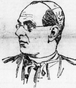
Erzbischof von Stabrowski.

Eine etwas überraschende Kunde brachte am gestrigen Sonntag der Draht aus Polen: Erzbischof Dr. von Stabrowski ist am Sonnabend Abend um 10 1/2 Uhr plötzlich verstorben. Der Tod erfolgte ohne jedes vorherige Anzeichen, man fand den Erzbischof anstehend schlafend in seinem Wohnstuhl; der herbeigerufene Arzt stellte Herzschlag als Todesursache fest.