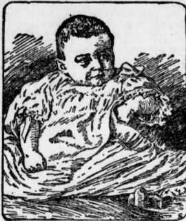
Prinz Wilhelm Sohn des Kronprinzenpaares (Vor einigen Tagen aufgenommen)

Wegen der Taufe des Kaisererbes brachten wir kein Bild. Heute erschienen wir wieder im Kostüm des Prinzen Wilhelm von Preußen. Das Bild, das mit herzlich angeregter Freude, sagt, das der Prinz sich ausnehmend prächtig entwickelt hat.