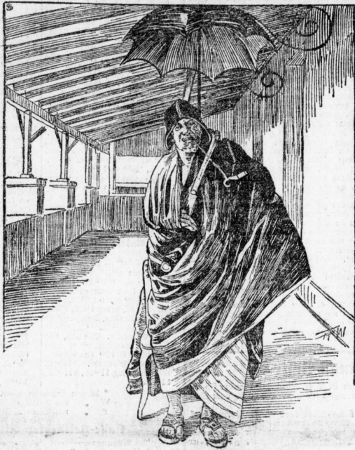
König Bechahn von Dahomeu.

Man achte genau auf nebensiehende Schutzmarke: „Pelikan mit Jungen“.