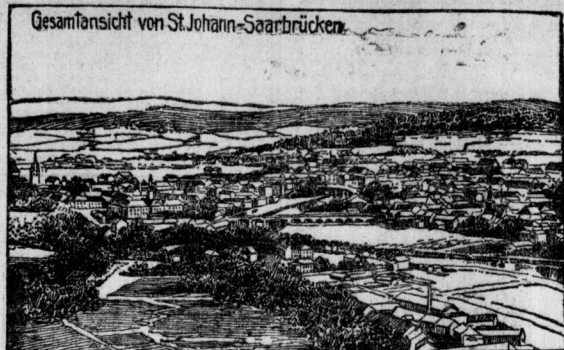
Gesamtsicht von St. Johann-Saarbrücken.