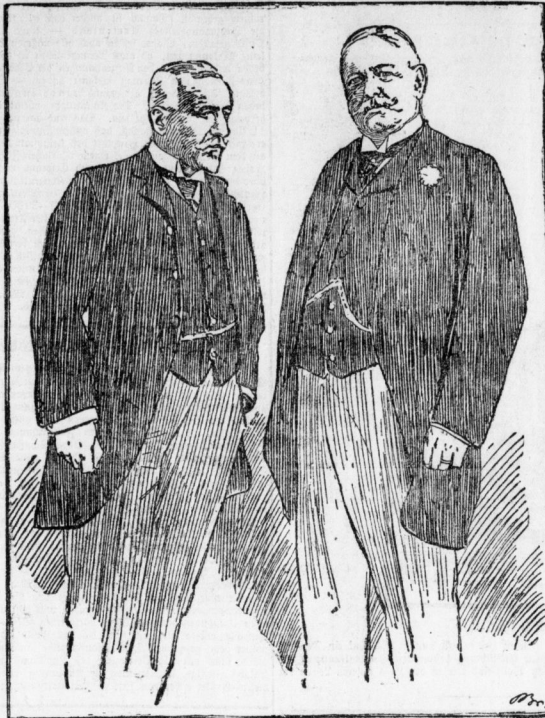
Tittoni und Fürst Bülow in Rapallo

Reichskanzler Fürst von Bülow will bekanntlich augenblicklich in Italien, und zwar in dem herrlich gelegenen Rapallo an der ligurischen Küste. Hier traf er mit dem italienischen Minister des Auswärtigen Tittoni zusammen, und beide Staatsmänner hatten bei den wechselseitigen Besuchen längere Unterredungen, bei denen es natürlich war, daß alle politischen Fragen, die gegenwärtig das internationale Leben beschäftigen, den Gegen-