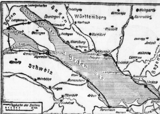
Die Abfahrt des Jettel'schen Dampfschiffes, bei seinem Ausfluge am 24. September nachmittags.

Ein gewaltiger Zug geht durch die Aemtern. Fast täglich sieht man von neuen Erregungen leuchtende Luftschiffe. Und nicht zum wenigsten ist es die deutsche Luftschiffahrt, die einen Sieg nach dem andern zu verzeichnen hat.