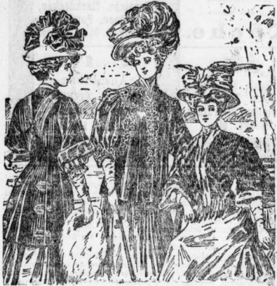
Abb. 1. Kabarett und Kunst... Abb. 2. Wälschjackett... Abb. 3. Färbung...