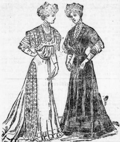
Abb. 4. Helle elegante Tuch... Abb. 5. Beuchstoffsätze aus...