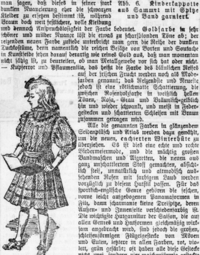
Abb. 6. Kinderfärberei... Abb. 7. Kinderkleidchen...