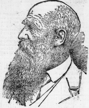
Herzog Georg II. von Meiningen.